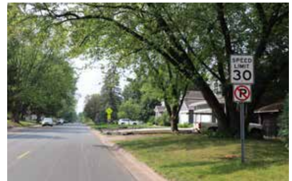
Los residentes de Edina pronto verán que se redujo la mayoría de los límites de velocidad dentro de la Ciudad. El cambio de 30 mph a 25 mph apunta a mejorar la seguridad de todas las formas de transporte.

Aproximadamente, habrá que quitar, reemplazar o agregar 250 señales. El plan