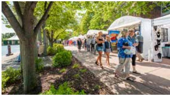
Calaamadee jadwalkaaga Sibtambar 11 iyo 12 ee Edina Fall ee Bandhigga Farshaxanka ee Centennial Lakes Park. Ka -qaybgalayaashu waxay sugi karaan isla tayada bandhigyada, cunnada iyo madadaalada sidii sanadihii hore. (Sawir Fayl)

Ku raaxayso Vibrant Art and Exhibitors sidaad u Lugayso Centennial Lakes Park